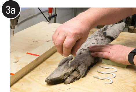
3a Skru i krok