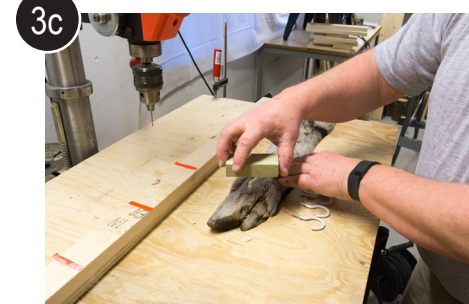
3c Skru i krok