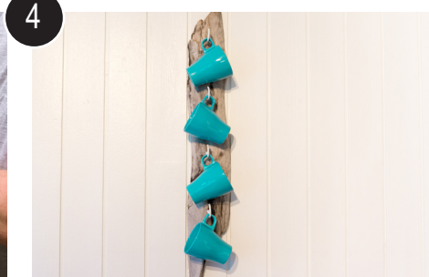
4 Ferdig produkt