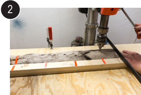
2 Flytt emnet og bor hull for hull