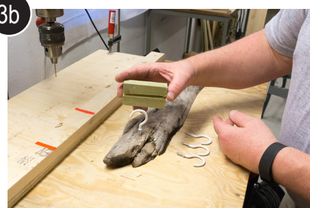
3b Skru i krok