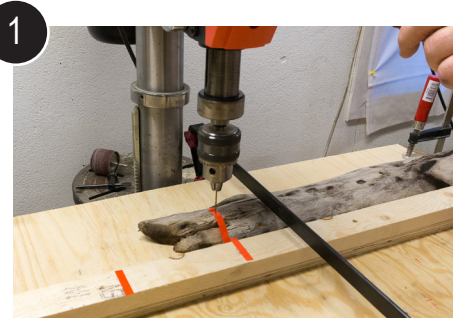
1 Legg emnet i forhåndsmerket jigg og bor første hull