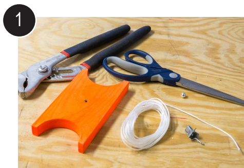
1 Hva trengs for montering