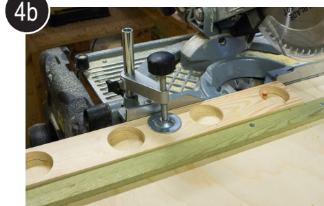
4b Legg emnet i skjærejigg og skjær emnene