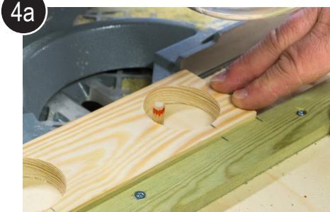
4a Legg emnet i skjærejigg og skjær emnene