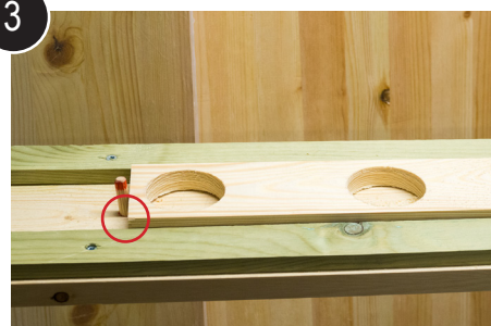
3 Plugg for siste hull