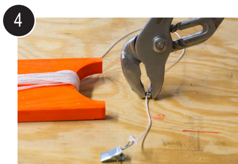
4 Fest på søkket