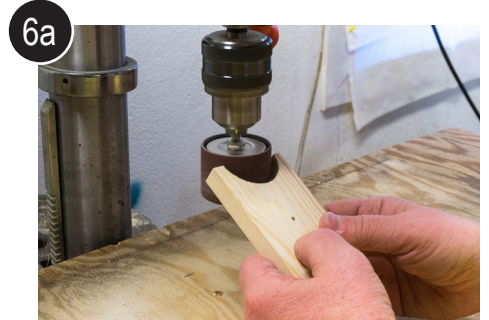
6a Pusse emnene