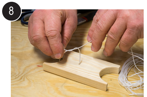
8 Tre og feste snøret