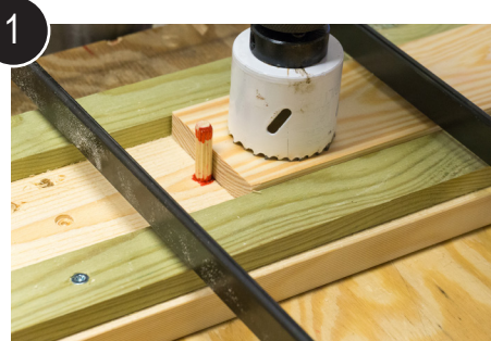
1 Legg emnet i jigg og bor første hull