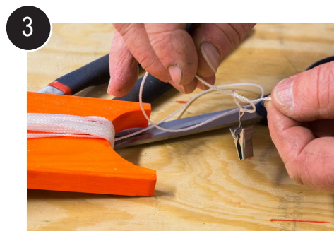
3 Tvinn snøret på emnet og knyt på agnklype