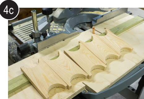
4c Legg emnet i skjærejigg og skjær emnene