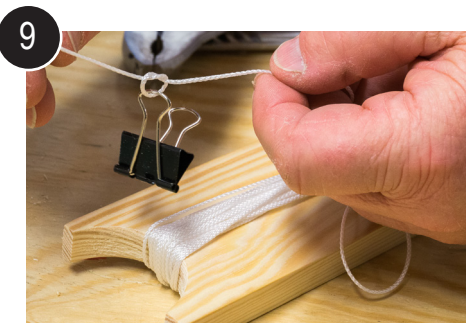
9 Tvinn på snøret og knyt på agnklype