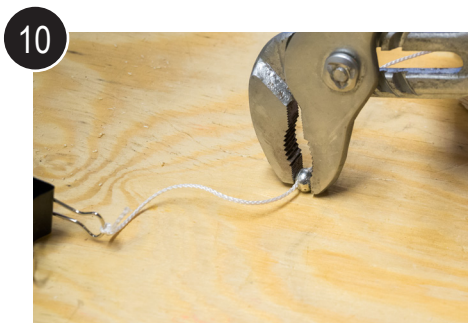
10 Fest på søkket