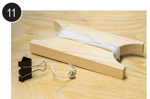
11 Ferdig snøre