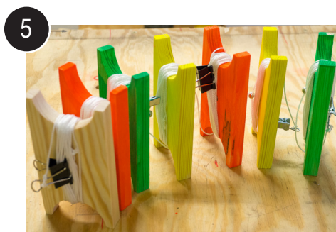
5 Ferdige produkter