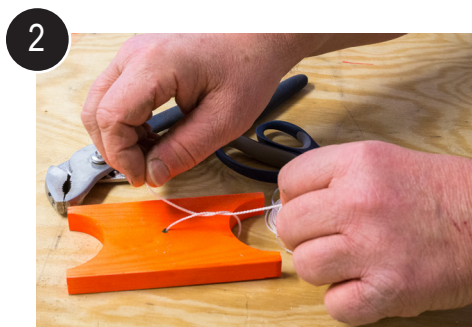
2 Tre og feste snøret