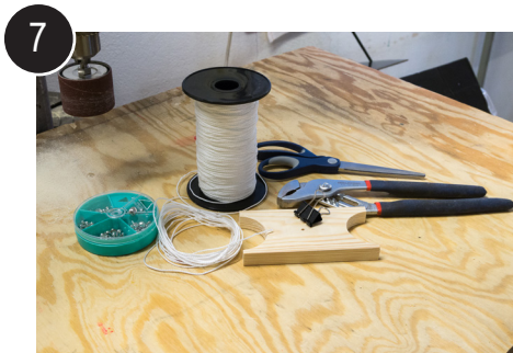
7 Det som trengs til montering