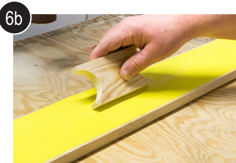
6b Pusse emnene