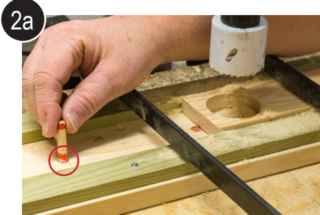
2a Flytt jiggplugg og bor neste hull