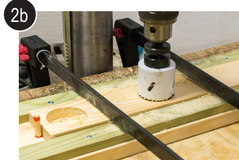
2b Flytt jiggplugg og bor neste hull