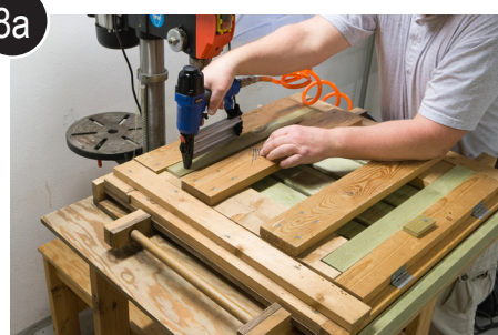
8a Alternativ til forboring og skruing, Bruk spikerpistol