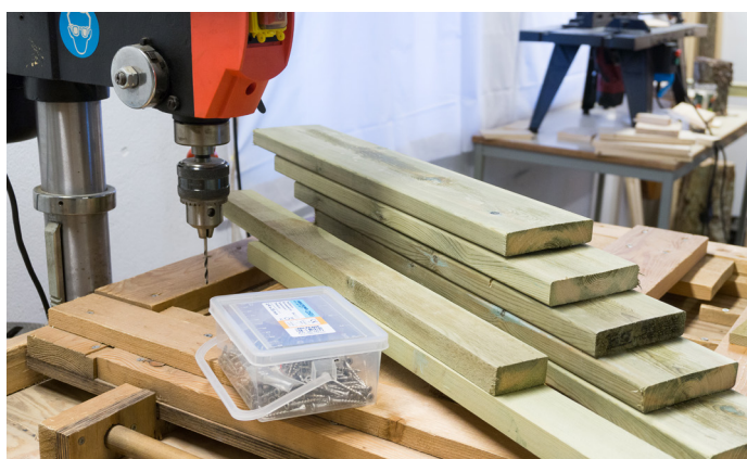
Materialer og skruer