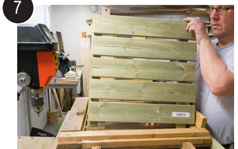
7 Ta hella ut av jigg