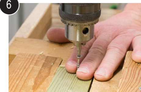
6 Skru spikerslagene til hellebordene