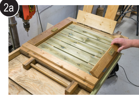
2a Lukk jigg