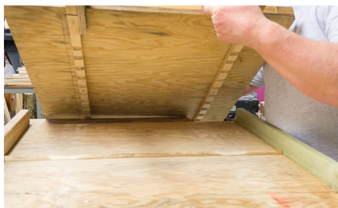
Jigg med hakkebrett