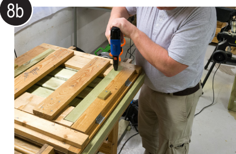
8b Alternativ til forboring og skruing, Bruk spikerpistol