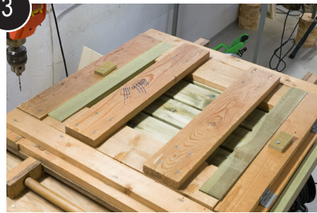
3 Legg spikerslag i jigg