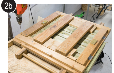
2b Lukk jigg