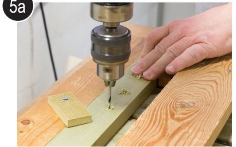
5a Flytt jigg et hakk fram til siste hull er bo-ret