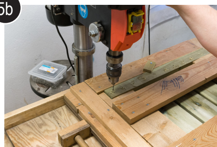
5b Flytt jigg et hakk fram til siste hull er bo-ret