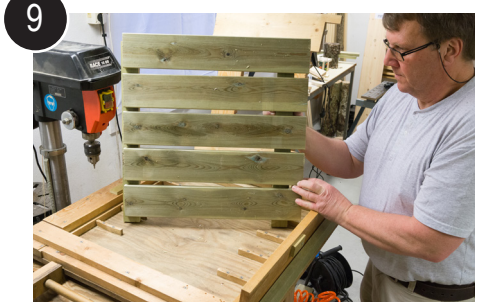
9 Ta hella ut av jigg