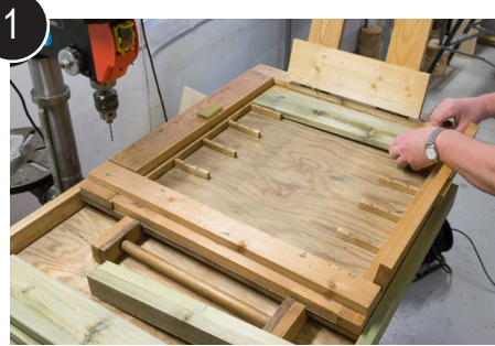
1 Legg bord med riktig lengde i jigg