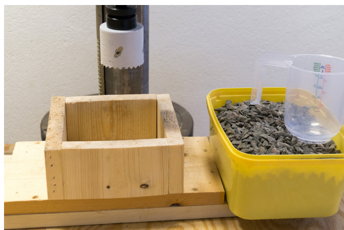
Verktøy jigg, singel og hullsag