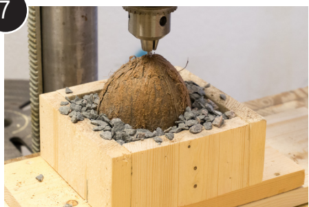
7 Bore opphengshull