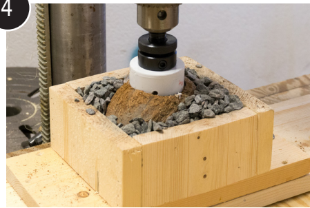
4 Bore gjennom skallet