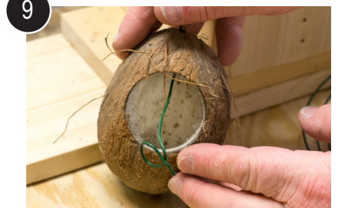
9 Tre ståltråd ovenfra og krøll som stopper i nøtt