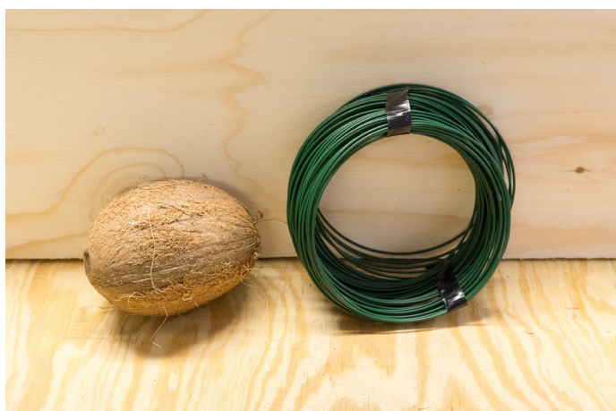
Kokosnøtt og ståltråd