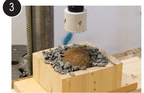
3 Klar for boring