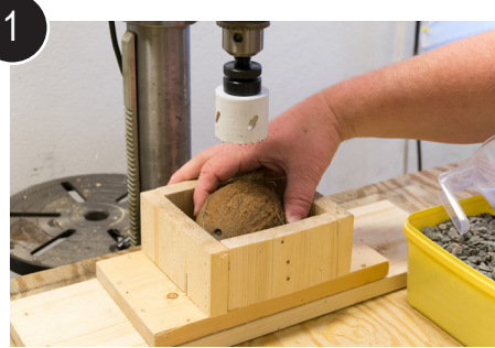
1 Kokosnøtt i jigg