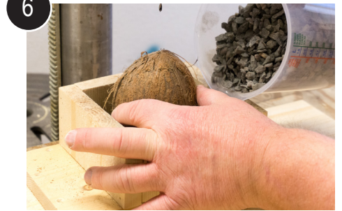
6 Plasser nøtt stående i jigg og hell i singel