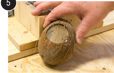
5 Ferdig boret